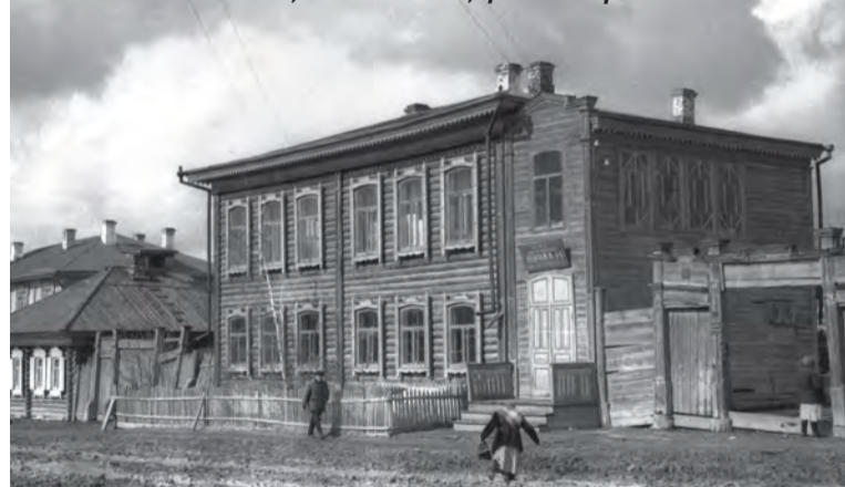
Начальная школа №1, 1960-1961 гг.