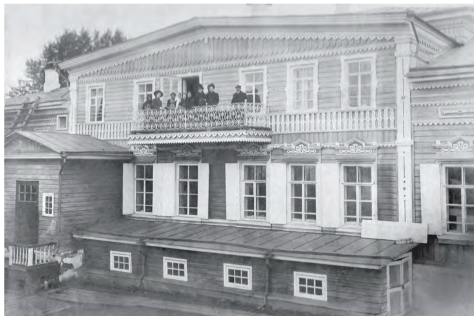
Тот же дом, вид со двора. Вероятнее всего, фото 1900-х годов.