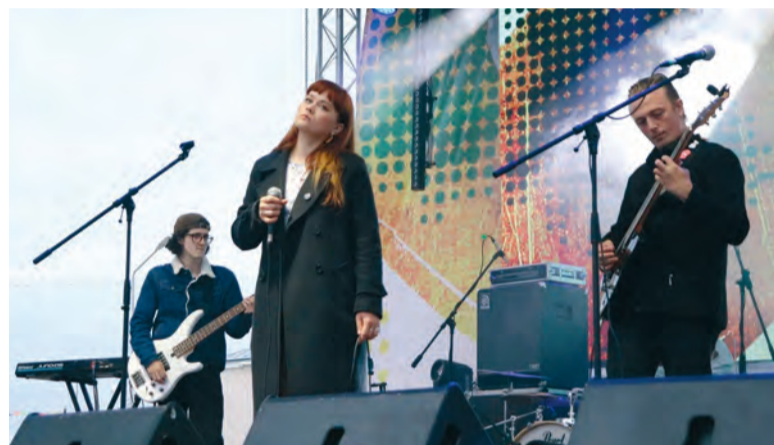
Группа «Осень в восемь» на фестивале «Тарская крепость. На стыке эпох»

в 2022 году - создание модельной библиотеки в с. Екатеринбургском.