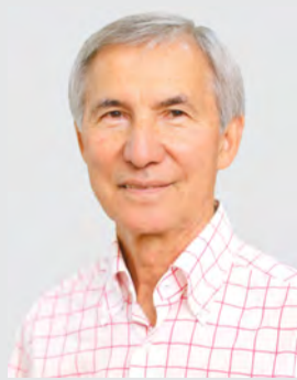
Мурат Адырбаев, депутат Законодательного Собрания Омской области:

январе мы с вами получили 32 автомобиля для первичного звена. И сегодня мы распределяем по центральным районным больницам еще 97 машин - в три раза больше, чем было в начале года. Все эти автомобили идут в муниципальные районы. На них будут обслуживать вызовы участковые терапевты, фельдшеры - те люди, у которых самый тяжелый труд и главная задача - оказать первичную помощь населению. Здесь есть машины высокой проходимости для сельских дорог, это позволит медикам оперативно приехать по вызову и оказывать помощь людям. На этих автомобилях можно возить лекарства, доставлять пациентов на обследование в больницу, госпитализировать в стационар. Уверен, что благодаря заботе наших врачей омичи будут быстрее выздоравливать, - отметил Александр Бурков.